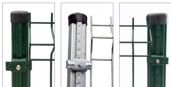
Lacat en verd 50x1.2 mm