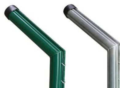
Corbat 50x1.2 mm