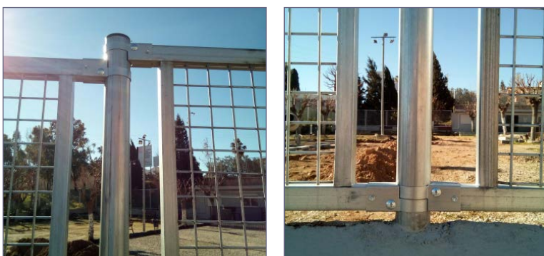
Detall brida per tub rodó de ø60 mm.

ADO, SA. es reserva el dret a modificar les especificacions dels productes sense avis previ.