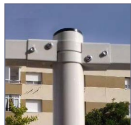
Detall brida per tub rodó de \varnothing 60 mm.