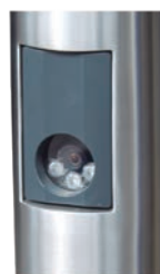
Detall lector de matrícules.