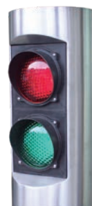
Detall del semàfor de LEDs.

Acer inoxidable ..... Ref. PCACCES04 Ferro lacat ..... Ref. PCACCES03